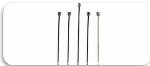
پرآب ساکشن NO: 6P 6P 7P 8P 5 با طول ۶۹۰ میلیمتر 6095