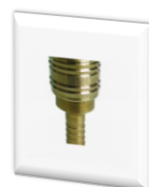
کوپلینگ هوا 2095