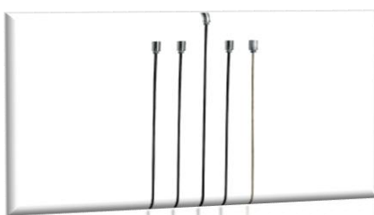
پرآب ساکشن NO: 6P 6P 7P 8P 5 با طول ۱۰۰۰ میلیمتر 6096