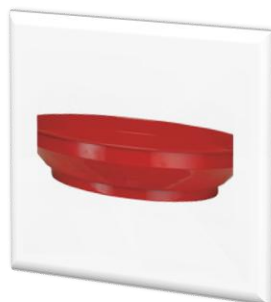
کیف با قطر ۵۲۰ میلیمتر 7903