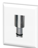
سوکت ساکشن 652