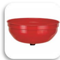
کیف با قطر ۳۷۵ میلیمتر 7902